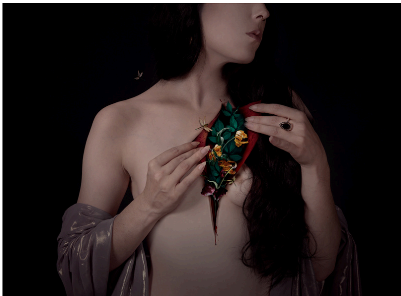
Audrey Piguet, Parasomnia, 2019

Avec Cellules, le MAF s'inaugure comme un espace d'expérimentation, de partage et d'émancipation, où l'exposition devient un territoire habité. Cette exposition fondatrice affirme que l'art est avant tout un lieu de mémoire, de transformation et de relation, un espace où les formes, les corps et les récits peuvent coexister, se réparer et se libérer."